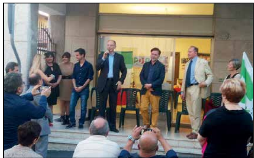
L'intervento dell'on. Letta alla presenza del Sindaco e dei dirigenti del PD.

Alla presenza di un centinaio tra iscritti e simpatizzanti, la cerimonia si è svolta all'esterno della sede, con gli invitati sotto il portico e gli intervenuti seduti di fronte. Hanno portato il loro saluto ed espresso considerazioni sull'importanza dell'aver una nuova sede, dopo la riflessiva introduzione del coordinatore Matteo Mirto, tutti gli ospiti presenti, a partire dal Sindaco di Montichiari, che ha sottolineato di valutare positivamente la decisione di scegliere "Borgosotto" per il nuovo insediamento, cioè il quartiere monteclarese in cui la "Sinistra" si è sempre positivamente caratterizzata. Dopo di Lui hanno preso la parola l'on. Bazoli, il Sindaco di Padenghe, in rappresentanza della Segreteria Provinciale e da ultimo l'on. Letta, nel frattempo giunto dal precedente